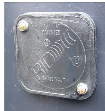
Erkennungseinheit (Transponder) an einem Gewerbekehricht-Container, Grösse ca. 4 x 4 cm

Wichtig: Die Transponder dürfen nicht selber montiert oder ummontiert werden.